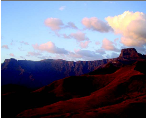
Die Witsieshoek Mountain Lodge kyk uit oor die Amfiteater in die noordelike Drakensberg met die Sentinel-piek heel regs.