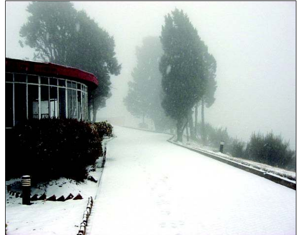
Sneeu verander die Witsieshoek Mountain Lodge in 'n sprokiesparadys. Die restaurant bied 'n pragtige uitsig oor die valle.