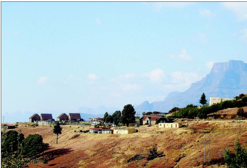
Die Witsieshoek Mountain Lodge in die Maloti-Drakensberg-oorgrenspark. Die oord het 'n reddingsboei gekry en gaan nou tot voordeel van besoekers – en die gemeenskap – opgeknap word.

deur die staat se armoedeverligtingsfonds toegestaan en TFPD het 'n verdere R3 miljoen bewillig vir opgradering en aanbouings.